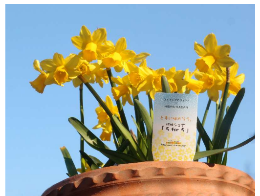
*写真はミニスイセン「テタテタ」の開花イメージ。花の色や花のボリュームは異なる場合があります。